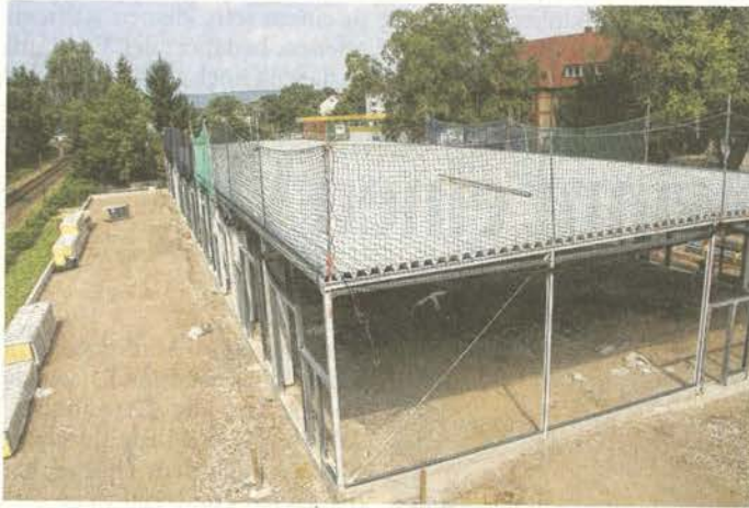
Hier finden Sportwagen, Oldtimer und Boote bald ein neues Zuhause: Rohbau der Garagenanlage der Firma Logemann am Südring.

Die Beherbergung von wertvollen Fahrzeugen ist ein wachsender Markt, dem die Firma Logemann mit dem Bau einer Garagenanlage „für Liebhaberfahrzeuge“ Rechnung trägt. Hier entstehen 20 Großgaragen, die speziell gebaut sind zur wert-