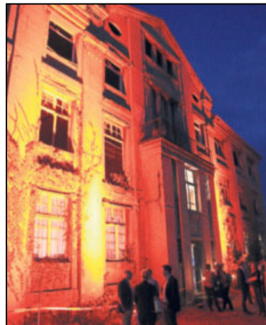
Von außen gestaltet sich der Anblick der bunt angestrahlten Fabrikfassade imposant.